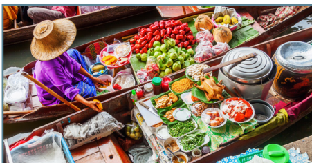
Il mercato galleggiante di Damnoensaduak